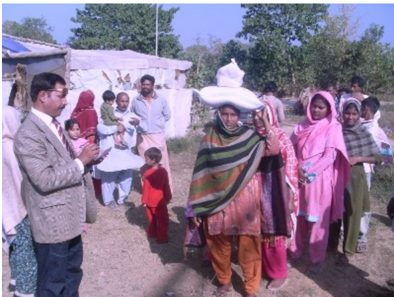
Gennem City Kirken kan du for eksempel støtte forfulgte kristne i Pakistan