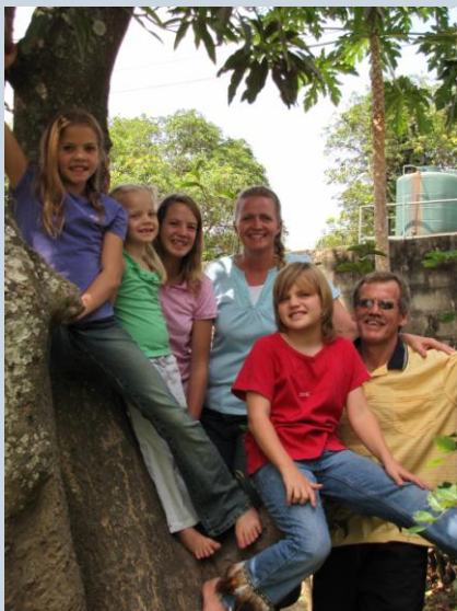
Under mangotræet, Eller skuldet et være 'i' mangotræet.